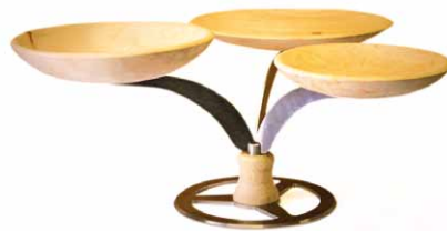
Tripus „Catering I“