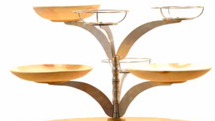
Tripus „Catering II“