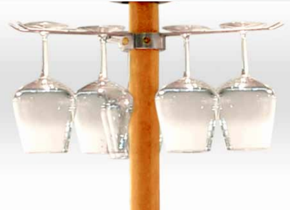
Glashalter / Portabicchieri