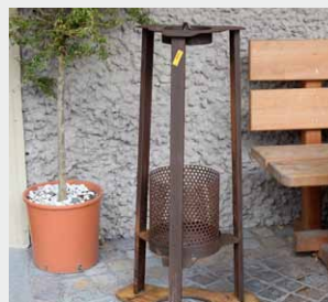
Mülleimer / Cestino

Alle Zubehöre sind auch einzeln erhältlich.