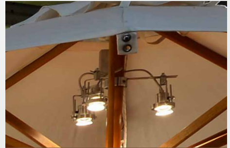
Lichter / Luci