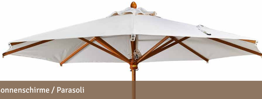
Sonnenschirme / Parasoli