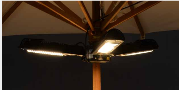
Heizstrahler / Impianto di riscaldamento 2000 W