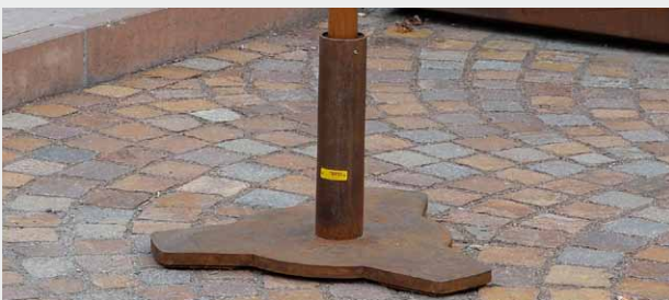
Schirmständer (40 kg) für Schirme bis 4 m Durchmesser Portaombrelloni (40 kg) per ombrelloni con diametri fino a 4 m